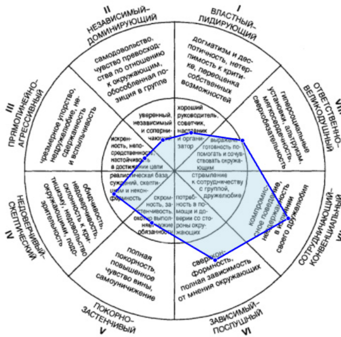
Рис. 2. Оценка реального «Я»

Результаты теста межличностных отношений респондента 3 представлены на рисунке 3 и в таблице 3.