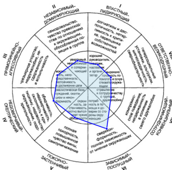
Рис. 3. Оценка реального «Я»